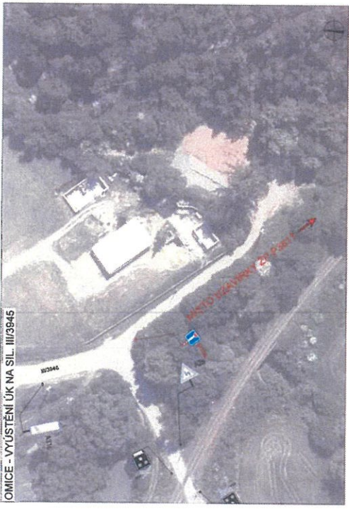
OMICE - VYÚSTĚNÍ ÚK NA SIL. III/3945